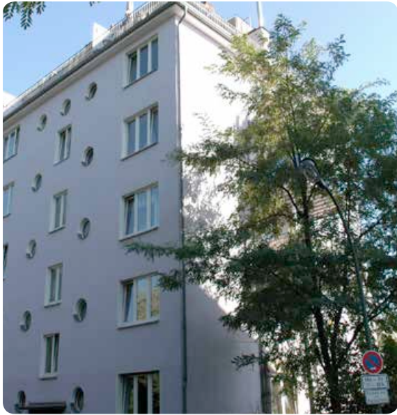
Ansicht Front und Seite