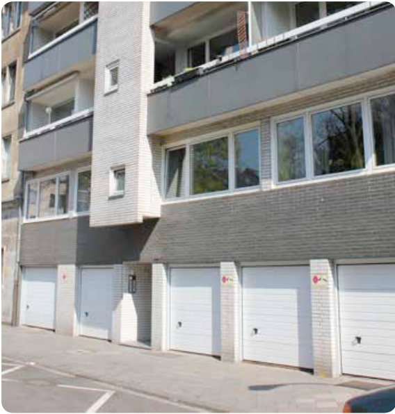
Eingangsbereich und Garagen